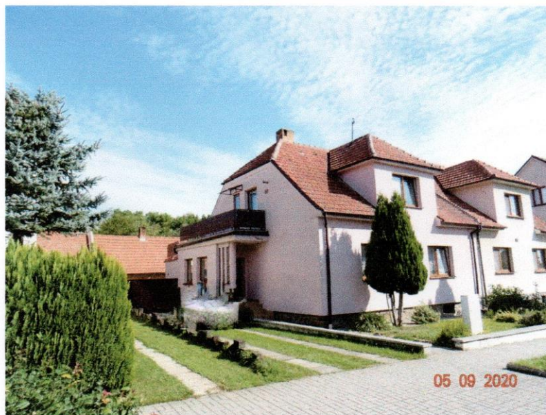
Rodinný dům na pozemku p. č. 1567