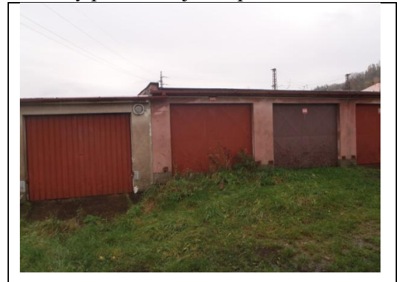
pohled od západu