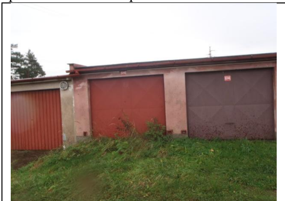
pohled od západu