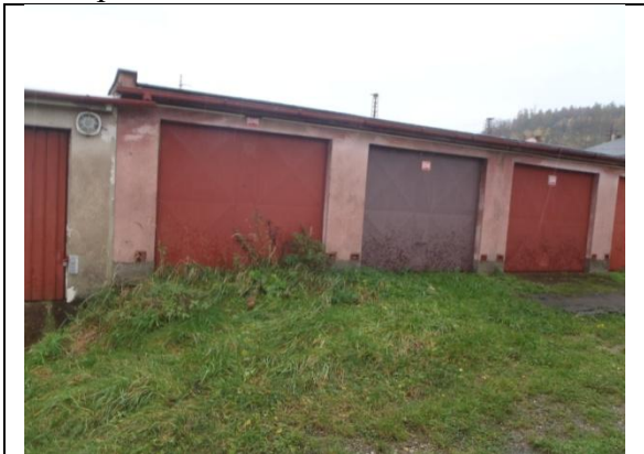
pohled od severozápadu