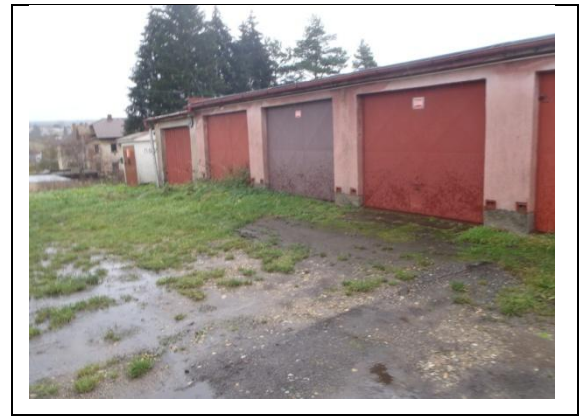
celkový pohled od jihozápadu