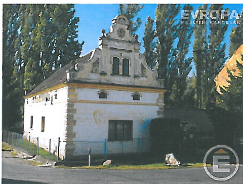
Lokalita: Pňovany Cena: 798 000,- Kč

Nabízíme k prodeji rodinný dům v obci Bučí. Dům je patrový dispozičně řešený jako 2+1 s možností půdní vestavby. Dům je možné využívat k trvalému bydlení či k rekreaci. Dům je postavený na rovinatém pozemku o výměře 604 m 2 . Na pozemku je postavena stodola. Bytová jednotka řešena velkou kuchyní, obývacím pokojem koupelnou, která je nová s nepoužitou vanou, WC, je zde i místo pro pračku. Dům prošel rekonstrukcí - nová plastová okna, rozvody elektřiny v mědi, topení alu plast, nové radiátory, rozvody vody v plastu, nový bojler. Vchodové i vnitřní dveře jsou též nové. Vytápění je zajištěno kotlem na tuhá paliva. Je zde studna na vlastním pozemku. Na hranici pozemku přípojka plynu, obecního vodovodu i kanalizace. V obci obecní úřad, potraviny, zastávka autobusu. Ostatní občanská vybavenost 7 km v obci Horní Bříza nebo 9 km Kaznějov.