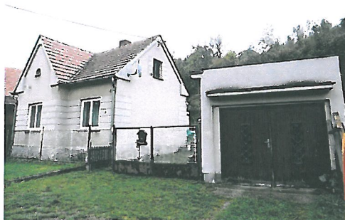
Lokalita: Plasy Cena: 890 000,- Kč

Nabízíme prodej rodinného domu 3+1, zastavěná plocha 180 m 2 na pozemku o výměře 464 m 2 , v obci Pňovany. V domě je nová kuchyňská linka, jinak je dům v původním, udržovaném stavu a je vhodný k rekonstrukci. Doporučujeme vzhledem ke klidné lokalitě a dobré dostupnosti do Plzně ( 20 minut). V blízkosti je Hracholuská přehrada.