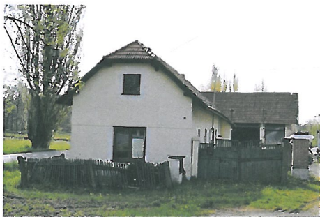
Lokalita: Bučí Cena: 1 200 000,- Kč

Nabízíme k prodeji rodinný dům v obci Bučí. Dům je patrový dispozičně řešený jako 2+1 s možností půdní vestavby. Dům je možné využívat k trvalému bydlení či k rekreaci. Dům je postavený na rovinatém pozemku o výměře 604 m 2 . Na pozemku je postavena stodola. Bytová jednotka řešena velkou kuchyní, obývacím pokojem koupelnou, která je nová s nepoužitou vanou, WC, je zde i místo pro pračku. Dům prošel rekonstrukcí - nová plastová okna, rozvody elektřiny v mědi, topení alu plast, nové radiátory, rozvody vody v plastu, nový bojler. Vchodové i vnitřní dveře jsou též nové. Vytápění je zajištěno kotlem na tuhá paliva. Je zde studna na vlastním pozemku. Na hranici pozemku přípojka plynu, obecního vodovodu i kanalizace. V obci obecní úřad, potraviny, zastávka autobusu. Ostatní občanská vybavenost 7 km v obci Horní Bříza nebo 9 km Kaznějov.